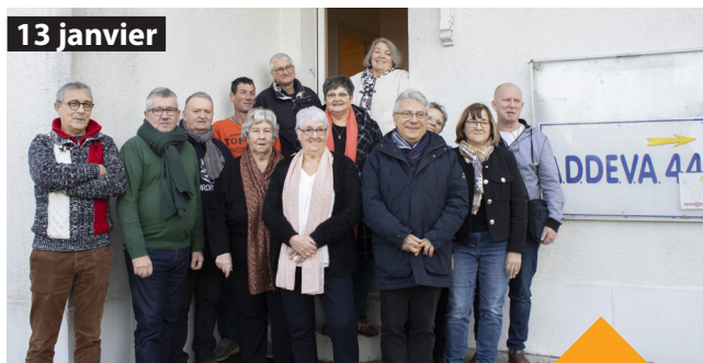
Nouveaux locaux pour l'ADDEVA44