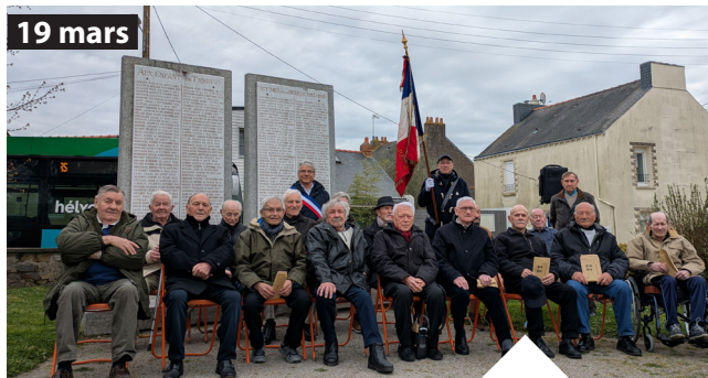
Une cérémonie de mémoire et de reconnaissance