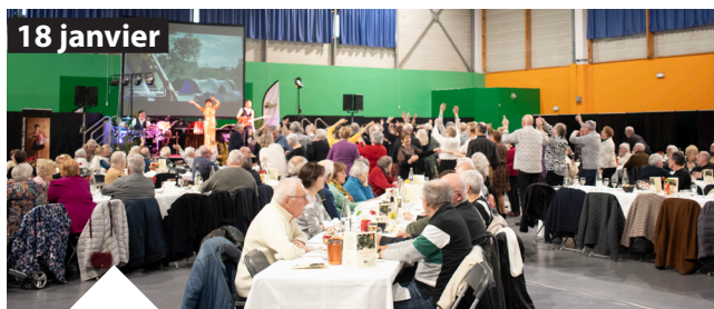
Repas des aînés