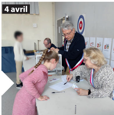
Conseil Municipal des Enfants