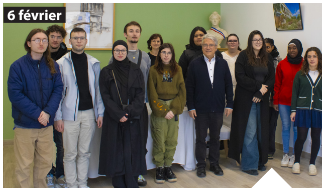
Rencontre à la Mairie avec de jeunes volontaires en service civique