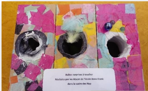
Boîtes surprises à toucher Réalisées par les ATSEM de l'école Anne Frank dans le cadre des Nap

Voici quelques activités proposées par les ATSEM aux enfants des écoles maternelles.