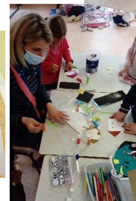
Happy Pauz' animé par K-ti