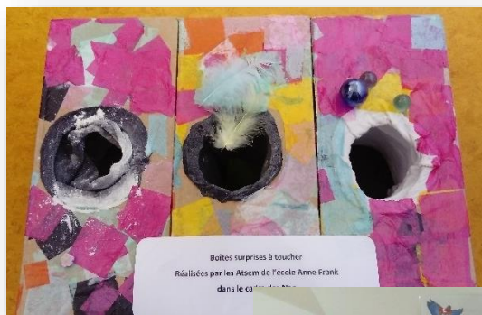
Boîtes surprises à toucher Réalisées par les Atsem de l'école Anne Frank dans le cadre de...

Voici quelques activités proposées par les ATSEM aux enfants des écoles maternelles