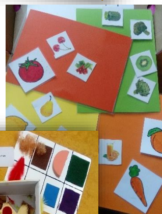
Associer les couleurs